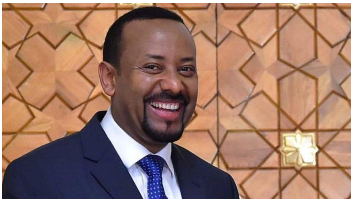
Etiopski premier Abiy Ahmed